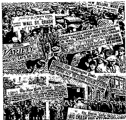
AA. VV, La storia illustrata del XX secolo , Firenze, Giunti, 1998, p. 111

"Le nebbie della disperazione sovrastavano il paese. Su ogni quattro lavoratori americani, uno era disoccupato. Le fabbriche che una volta oscuravano il cielo di fumo stavano ora inopere, simili a fantasmi silenziosi o a vulcani estinti. Famiglie dormivano in baracche di cartone catramate o in caverne foderate di latta e scavavano come i cani nei depositi di rifiuti di cibo. In ottobre (1932), l'ufficio di sanità della città di New York aveva riferito che oltre un quinto dei bambini nelle scuole pubbliche soffriva di denutrizione. Migliaia di ragazzi vagabondi scorrazzavano come selvaggi per le strade della nazione. Marciatori della fame, dal viso scavato e pieno di risentimento, percorrevano le gelide strade di New York e Chicago. Nelle campagne l'irrequietezza era già sfociata in violenza". (A.M. Schlesinger Jr., in L'età di Roosevelt , a cura di F. Mancini, Bologna, Il Mulino, 1962)