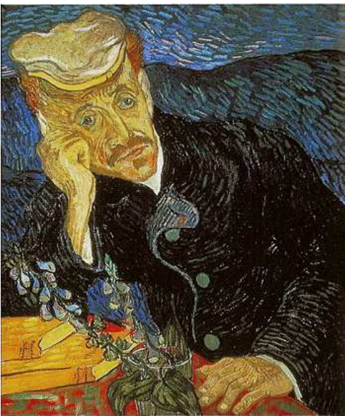
"Il ritratto del dottor Gachet", Vincent Van Gogh, 1890, collezione privata

-le mente di Van Gogh e quella di Gachet sembrano collegate e in contatto l'una con l'altra