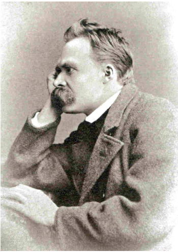
Friedrich Wilhelm Nietzsche

>lotta:conflitto tra popoli diversi, nel succedersi di invasioni nella storia della Grecia arcaica.