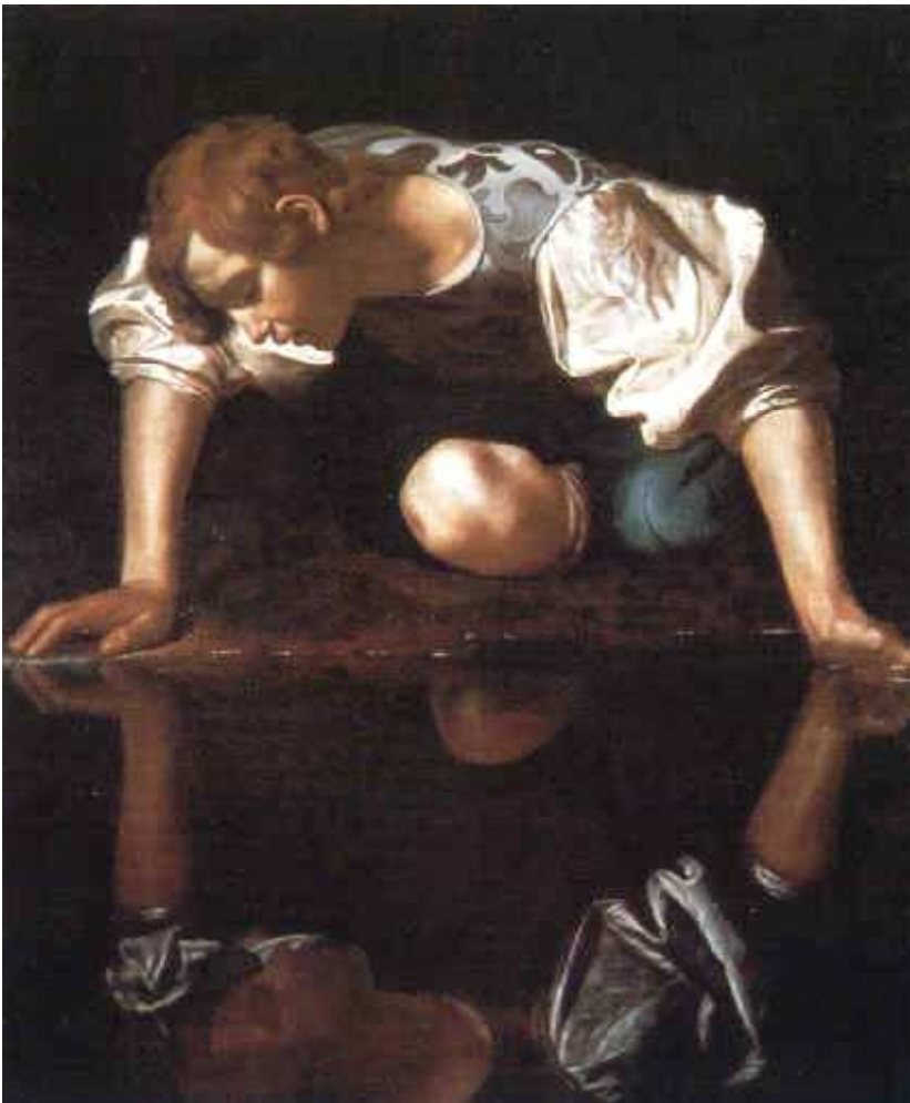
Caravaggio, "Narciso", 1573-1610, Roma, Galleria d'arte antica di Palazzo Barberini